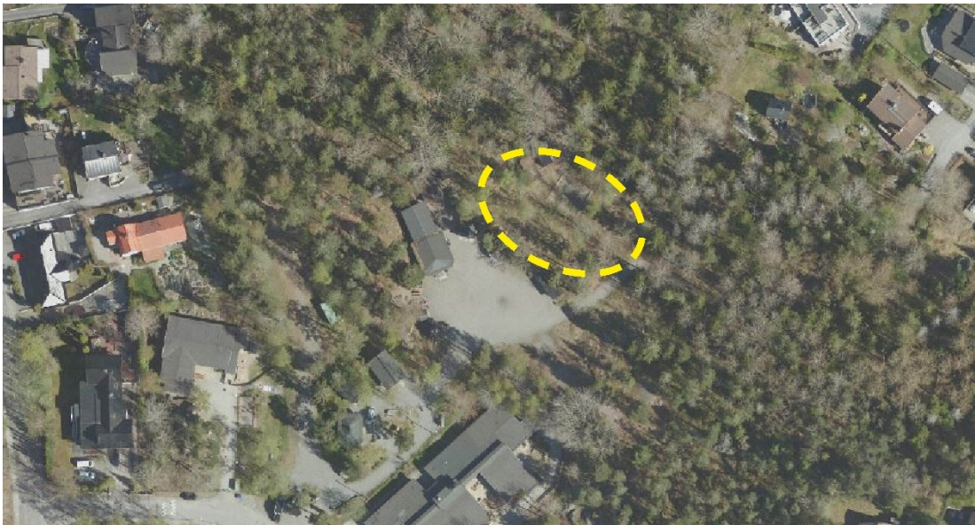
Bild 4. Platsen att tycka till om

Det inkom nära 140 synpunkter från boende på frågan Vad vill du kunna göra i parken? Med parken avsågs den gulmarkerade ytan där de huvudsakliga åtgärderna koncentreras.