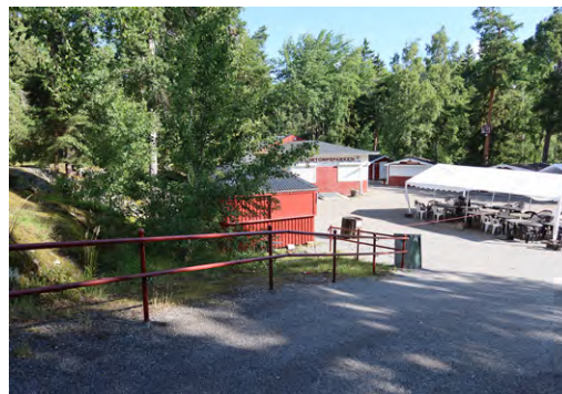
Bild 1 - 3. Platsen idag